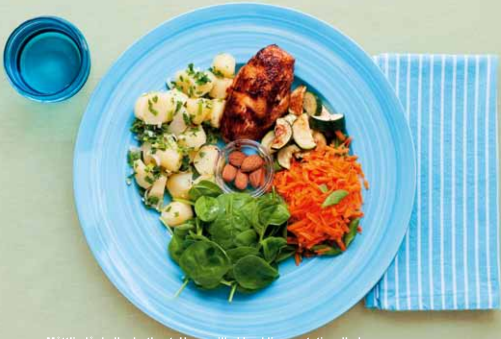
Måttlig lågkolhydratkost. Ugnsg Grillad kyckling, potatissallad, squash, sallad med spenat, morot, sockerärter och mandel. Måltiden innehåller 596 kcal – 26 E% protein, 41 E% fett, 34 E% kolhydrat.