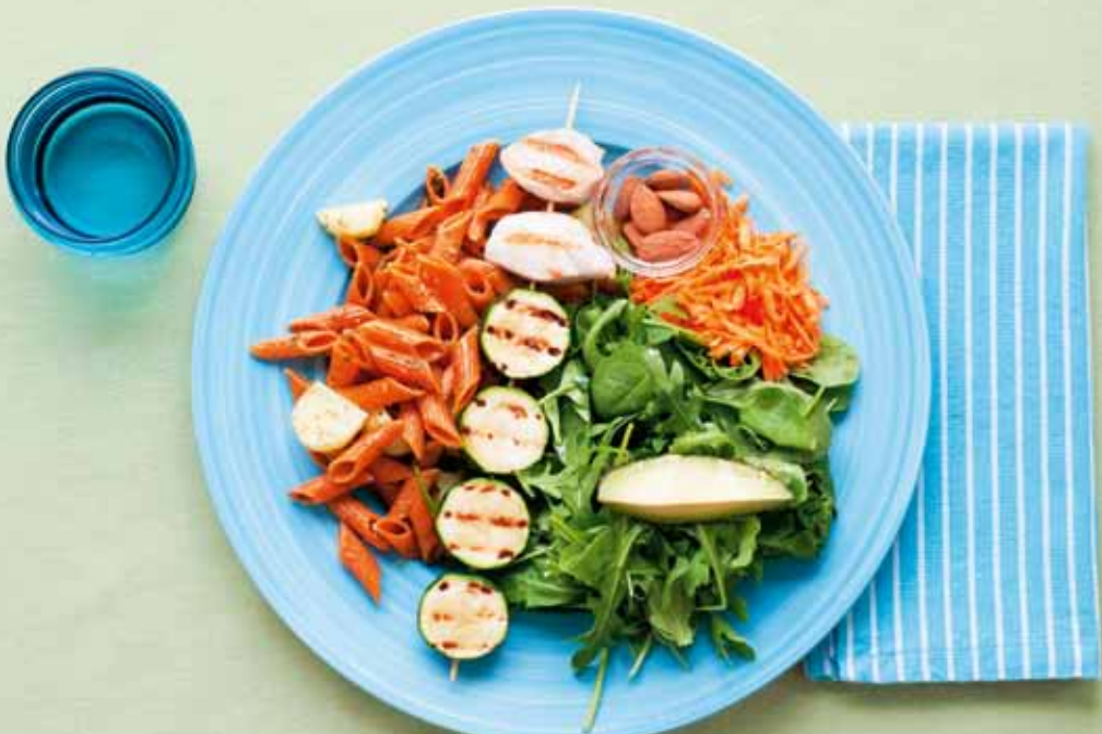
Medelhavskost. Kyckling- och squashspett, pasta och potatis i pesto, sallad med spenat, rucicola, morot, avokado och sötmandel. Måltiden innehåller 602 kcal – 18 E% protein, 37 E% fett, 45 E% kolhydrat.

HDL-kolesterol och minskar triglycerider). Kosten ger goda effekter även om man inte dricker alkohol.