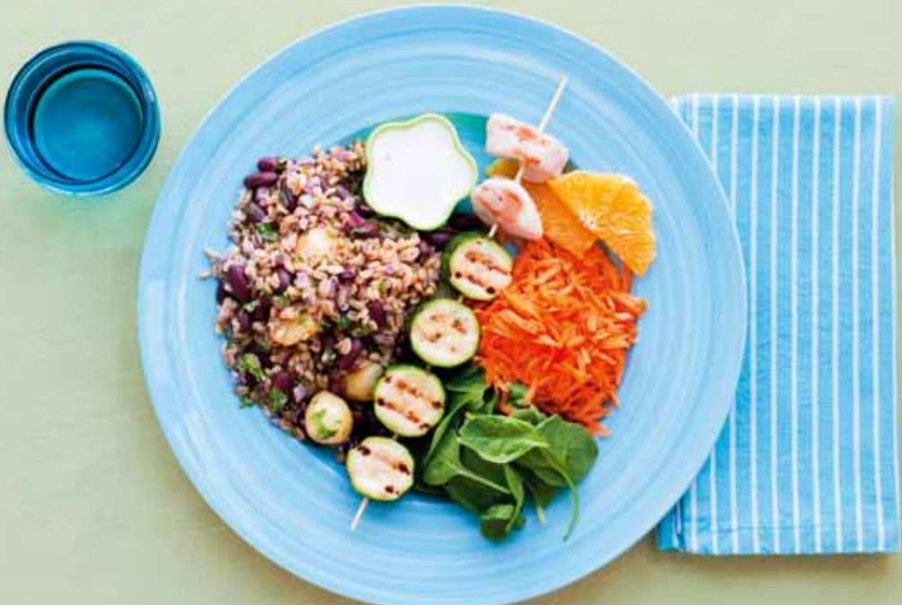
Traditionell diabeteskost med lågt GI. Kyckling- och squashspett, pytt på bönor, potatis och gryn, kall sås och sallad med morot, apelsin och spenat. Måltiden innehåller 599 kcal – 18 E% protein, 28 E% fett, 55 E% kolhydrat.

Hos de överviktiga patienter som inte lyckas gå ner i vikt trots omläggning till traditionell diabeteskost med lågt glykemiskt index, kan det vara bra att titta närmare på typen av kolhydrater och ge råd om att välja kolhydratrika livsmedel med lägre energiinnehåll, såsom frukt och rotfrukter.