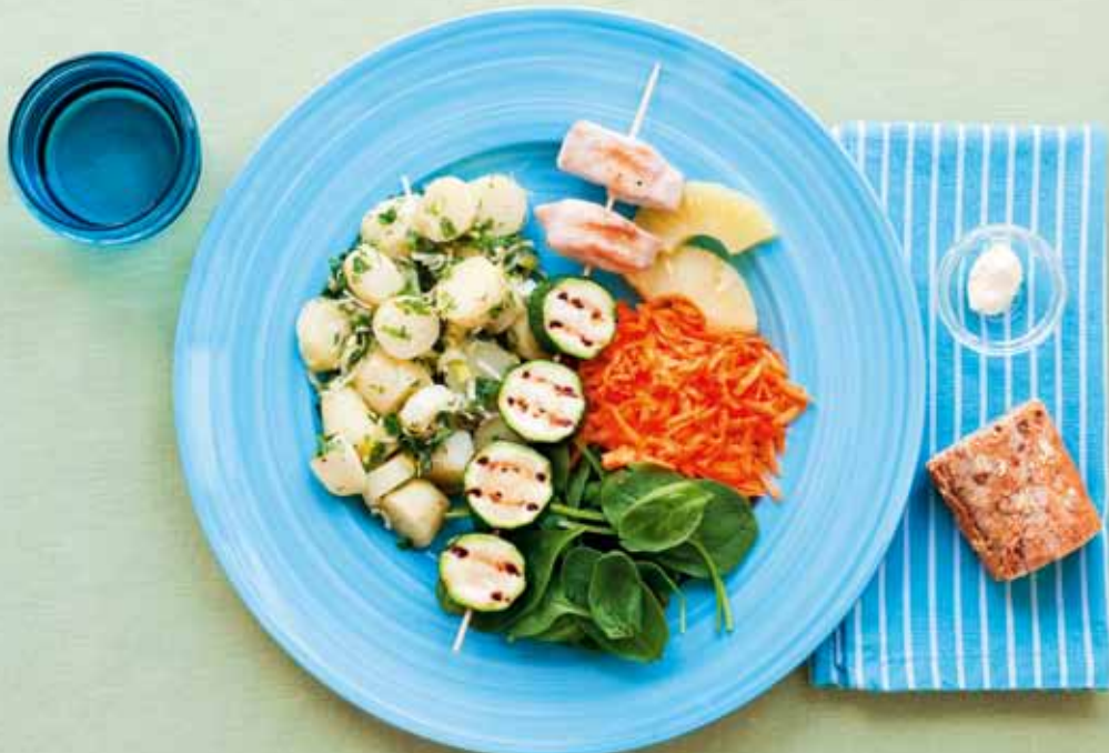
Traditionell diabeteskost. Kyckling- och squashspett, potatissallad, grahamsbaguette och sallad med morot, ananas och spenat. Måltiden innehåller 597 kcal – 18 E% protein, 28 E% fett, 55 E% kolhydrat.