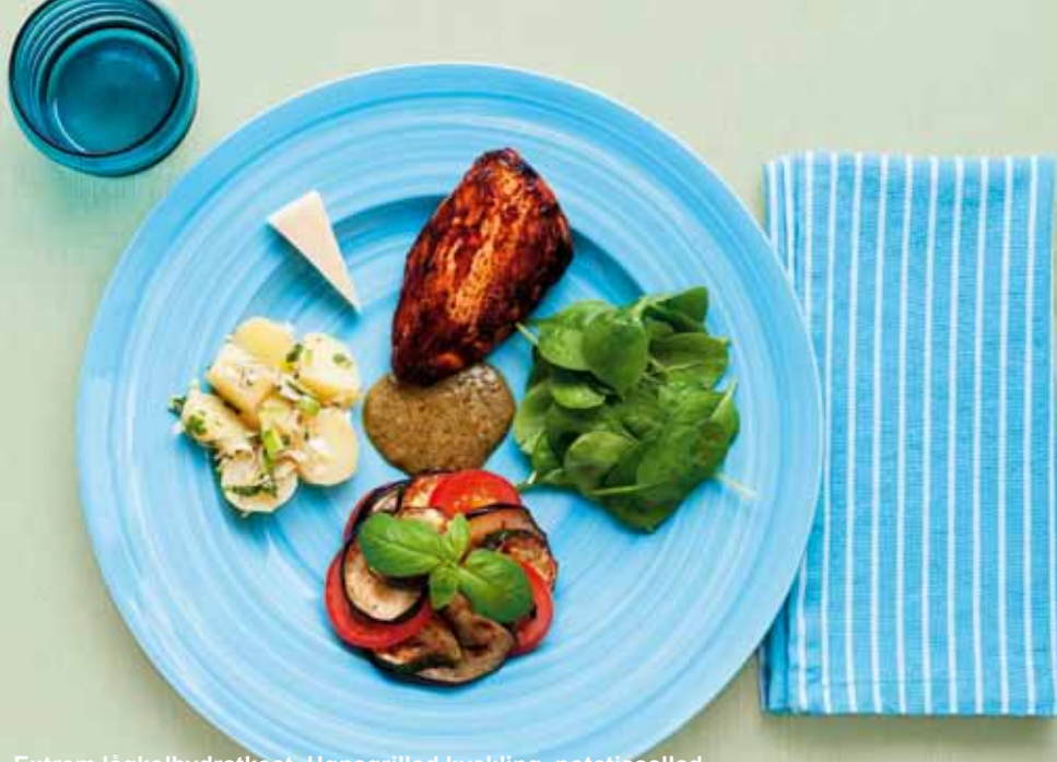
Extrem lågkolhydratkost. Ugnsg Grillad kyckling, potatissallad, grönsaksbakelse, parmesanost, spenat och gräddsås med pesto. Måltiden innehåller 602 kcal – 29 E% protein, 56 E% fett, 15 E% kolhydrat.

I extrem lågkolhydratkost står fett för mer än 50 procent av den totala energin. Det är därför viktigt att välja livsmedel som innehåller omättade fetter [9, 11].